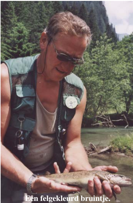
Een felgekleurd bruinje.

sjerwater dat door de warmte gesmolten was, het water rond acht uur deed afkoelen en troebeler kleuren. Ik waagde mijn geluk andermaal op het meer. Nog een drietal beekforellen kon ik aan de droge vlieg haken. Ook ik moest rond negen uur het vissen staken wegens een plotseling sterk opstekingende wind. Mijn bootje drifte te snel en ik had geen gereedschap bij om dit te remmen. De evaluatie van onze visdag bleek positief niettegenstaande de zingende hitte en schroeiende zon. Mooie vissen zijn er te vangen en daar gaat het tenslotte om.