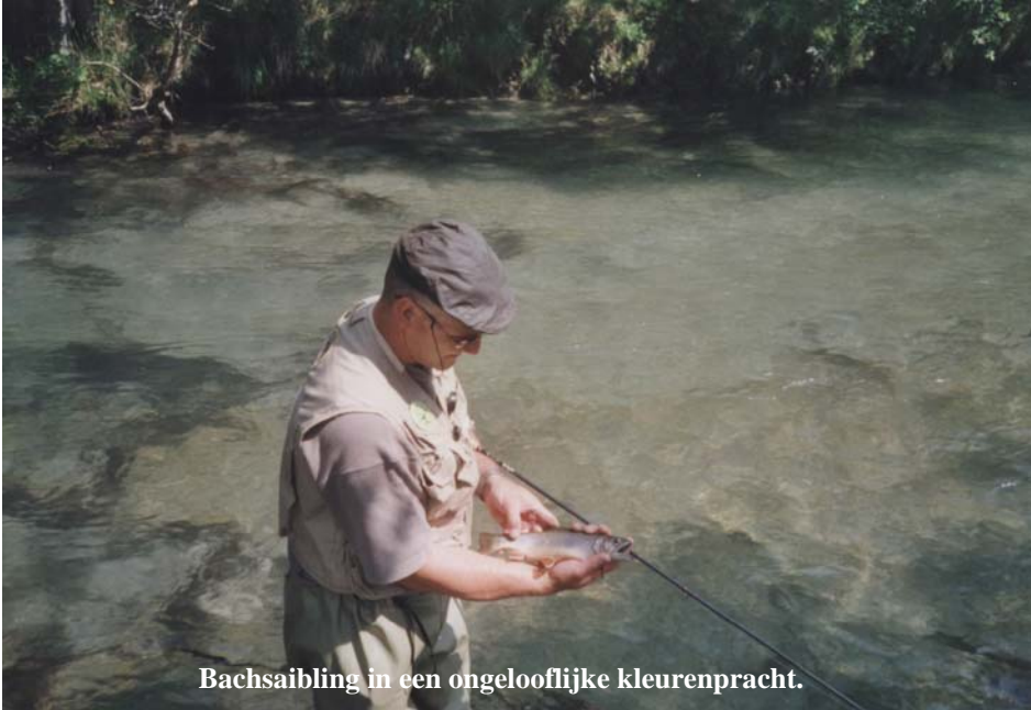
Bachsaibling in een ongelooflijke kleurenpracht.